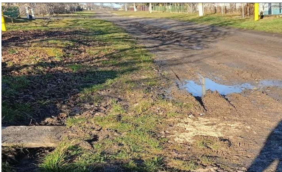
Str. Konstantin Kalinovski, s.Sfîrcea