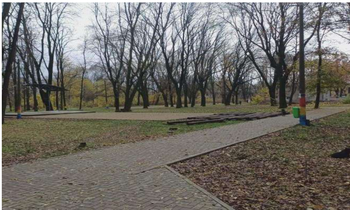
Scena de vară din Parcul Central

Necesități: Este necesară dezvoltarea și modernizarea infrastructurii recreative din parcul orașenesc prin amenajarea pistelor pentru bicicliști, extinderea și modernizarea spațiilor verzi, precum și crearea terenurilor de joacă și a terenurilor sportive. Aceste măsuri vor contribui la încurajarea unui mod de viață sănătos și activ în rândul populației.