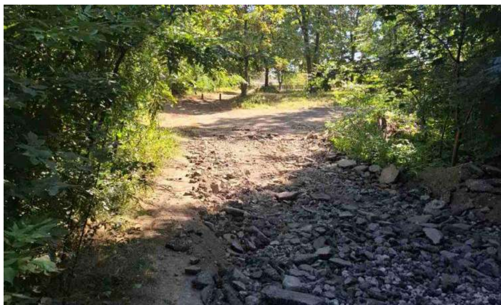
Un pod din Parcul Central, pe albia râului Glodeanca

Traficul auto și lipsa infrastructurii pietonale de calitate afectează confortul urban și calitatea aerului. Prin urmare, sunt necesare intervenții orientate spre ecologizarea spațiilor publice, îmbunătățirea managementului deșeurilor și promovarea mobilității durabile.