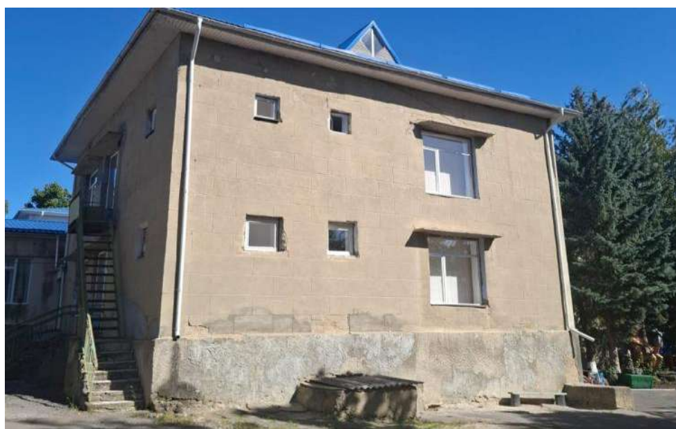
Grădinița nr.5 din or.Gloden

Participarea civică este redusă, iar lipsa spațiilor publice atractive limitează interacțiunea socială, în special pentru tineri și vârstnici. Aceste aspecte justifică necesitatea unor intervenții sociale integrate, orientate spre incluziune, siguranță și revitalizarea vieții comunitare.