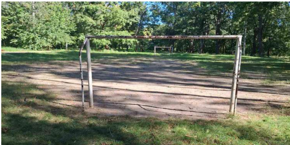
Stadion din Parcul Central