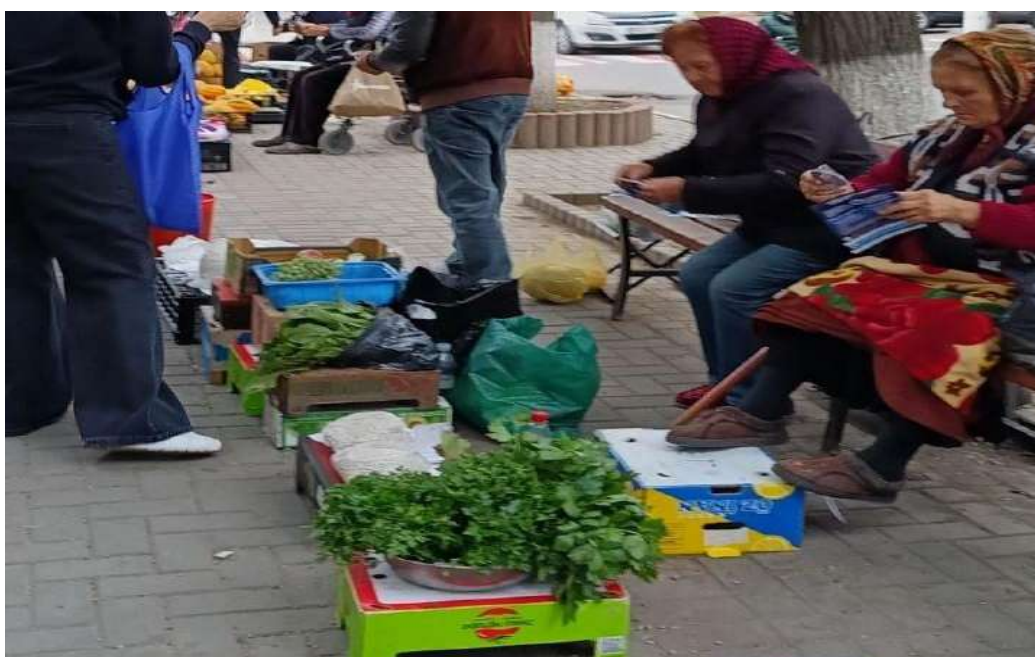
Comercializarea stradală a producției autohtone

Revitalizarea economică a zonei necesită recalificarea spațiilor urbane, stimularea antreprenoriatului local, susținerea IMM-urilor și integrarea funcțiilor economice compatibile cu caracterul central al zonei.